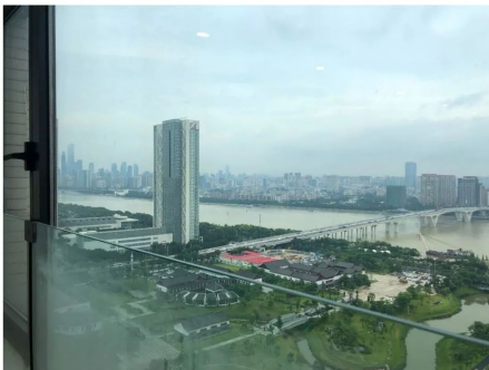
望江景色 (部分单位)